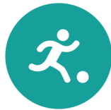
Spel en beweging / bewegingsonderwijs